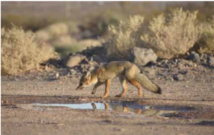
Foto 3. Zorro gris ( Lycalopex griseus ) buscando agua en charcos formados en cargadero de agua para riego de caminos.

tos son puntos de atracción en ambientes con baja disponibilidad de agua, generando riesgo con el cruce de fauna. Las fotografías 2 y 3 muestran ejemplares de fauna atraídos a fuentes de agua relacionadas con la actividad de la operación. La primera, una martineta ( Eudromia formosa ) atraída a un charco de agua formado por condensación de agua de sistemas de aire acondicionado. Estas aves de actividad crepuscular o nocturna interaccionan a plena luz del día para acceder a este recurso. En el caso de la fotografía 3, un zorro gris ( Lycalopex griseus ) en un cargadero de agua para riego.