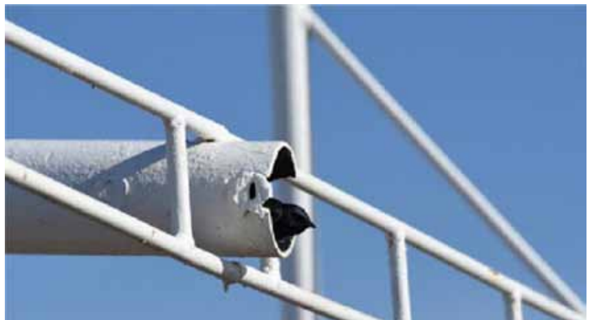
Foto 7. Golondrina negra ( Progne modesta ) anidando en estructuras de yacimiento en el norte de la Patagonia.