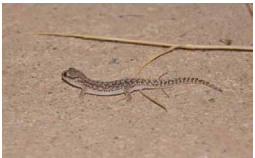
Foto 4. Gecko de Darwin ( Homonota darwinii ) buscando refugio y alimento en zona de campamento de un yacimiento en el norte neuquino.

Las instalaciones, de por sí, pueden ser utilizadas como refugios por animales. La presencia humana desalienta a los predadores a acercarse por lo que pequeños mamíferos, reptiles y anfibios pueden encontrar refugio, a la vez de alimento en las instalaciones y zonas de uso residencial. Como es el caso del Gecko de Darwin ( Homonota darwinii ) fotografiado residiendo bajo una casa en un yacimiento.