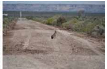
Foto 9. Fauna en cruce de caminos: Guanaco, Zorro gris y Mara en caminos de acceso a yacimientos.