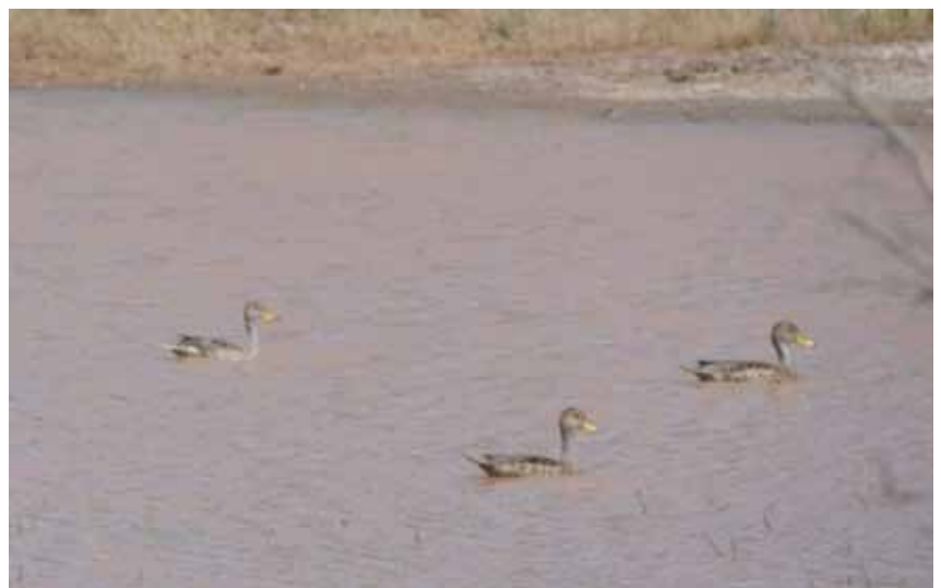
Foto 1. Pato maicero ( Anas georgica ) en zona de préstamo de material para camino de acceso, luego de copiosa lluvia en un yacimiento del norte patagónico.

En la foto 1 puede verse un grupo de patos barcinos ( Anas georgica ), en una zona de aporte de material para nivelación inundada con agua de lluvia en un yacimiento del norte patagónico. La acumulación de agua al costado del camino duró un mes y medio hasta que se evaporó completamente y no llegó a desarrollar a simple vista vegetación asociada u otras comunidades.