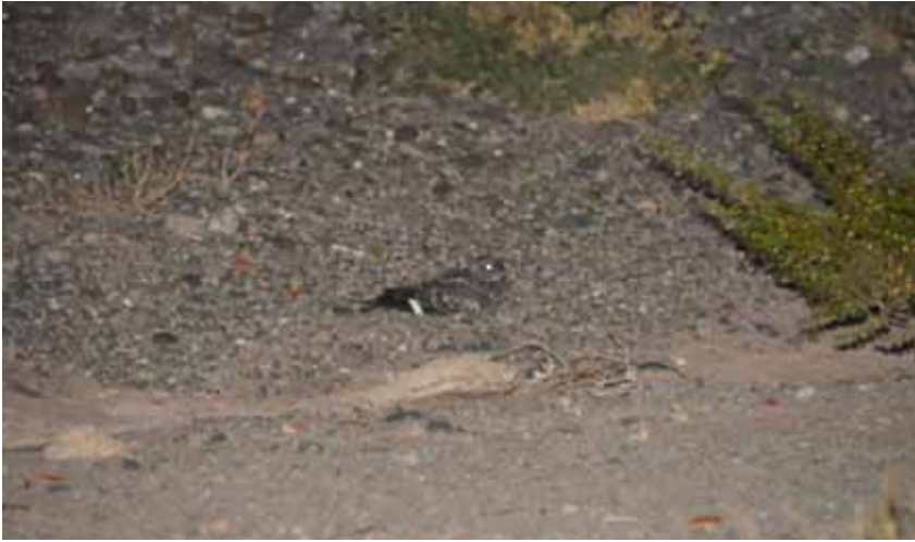
Foto 5. Atajacaminos Ñanarca alimentándose de insectos atraídos por las luminarias

observados en caminos, canteras y sitios de aporte de materiales.