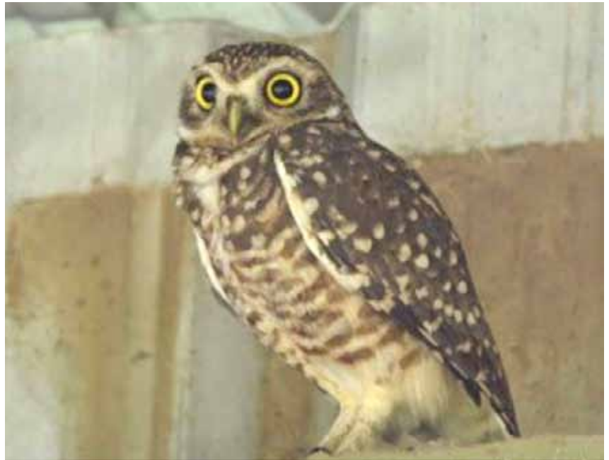
Foto 6. Lechucita vizcachera ( Athene cunicularia ) bajo tinglado de depósito residuos. Yacimiento

La infraestructura no es la única alteración en el entorno que brinda la posibilidad de conseguir refugio a la fauna. Las alteraciones topográficas también son utilizadas por algunas especies debido a la protección a factores climáticos que puedan brindarle. Nidificación y zonas de descanso o abrigo del viento han sido