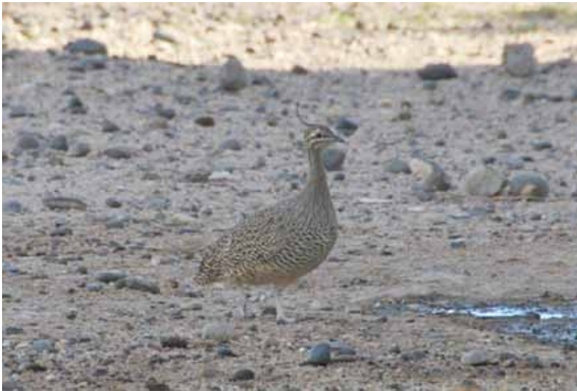
Foto 2. Martineta común ( Eudromia formosa ) buscando agua de condensación de aire acondicionado fuera de su horario normal de actividad. (Crepuscular o verpertino).