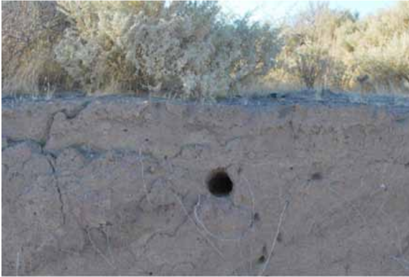
Foto 8. Nidificación inusual de Lechucita vizcachera ( Athene cunicularia ) sobre la pared de corte de apertura de camino en el norte de la Patagonia.

didadas de acción para contrarrestar su efecto.